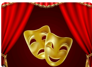
Théâtre proposée par le Relais