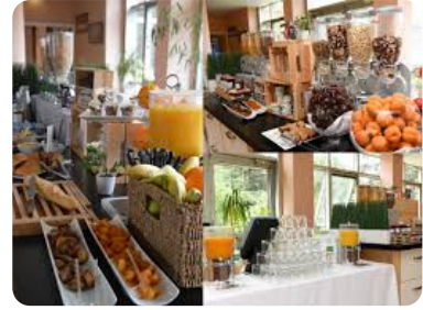
Pension complète Un service de restauration complet, incluant le petit-déjeuner, le déjeuner et dîner.