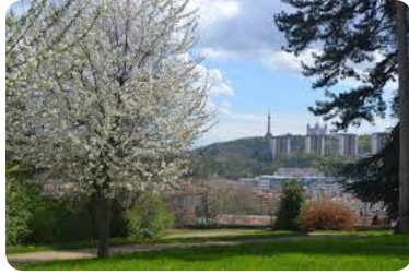
Domaine de Valpré 1 chemin de Chalin à Écully Un site magnifique !