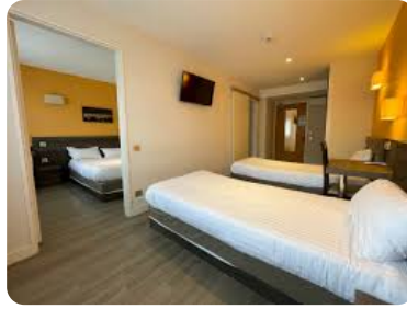
Hôtel - chambres Possibilité : chambre simple, chambre double et chambre triple.