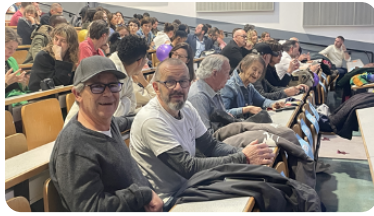
La finale régionale de l'Éloquence du bégaiement