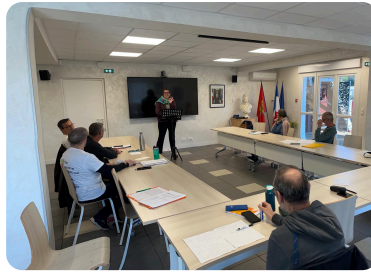
La formation EQD "Aphasie"